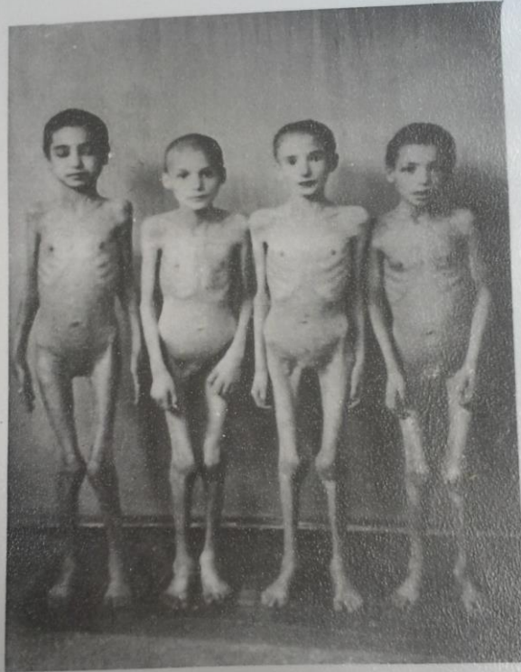
Children (probably Gypsies), victims of Dr Josef Mengele's experiments. Picture taken in camp photo studio.