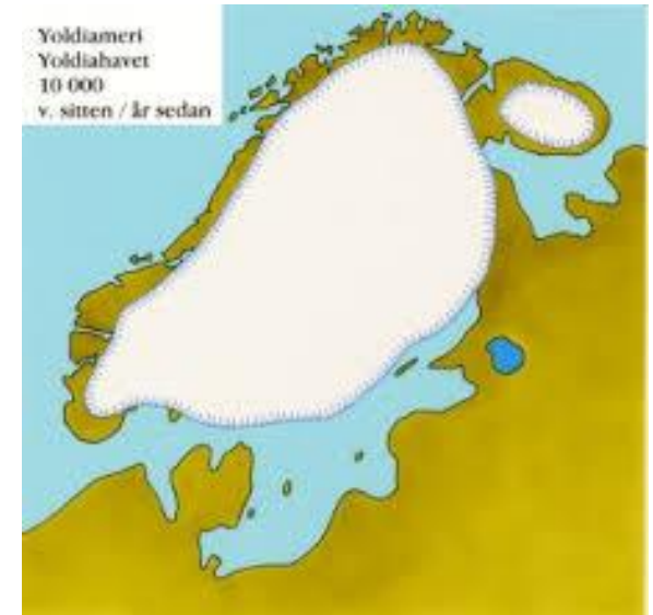
jääkausi, jää peitti maan