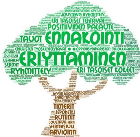
Kuva: Eriyttämisen keinoja

eNorssin kehittyvä pedagoginen tuki -työryhmä