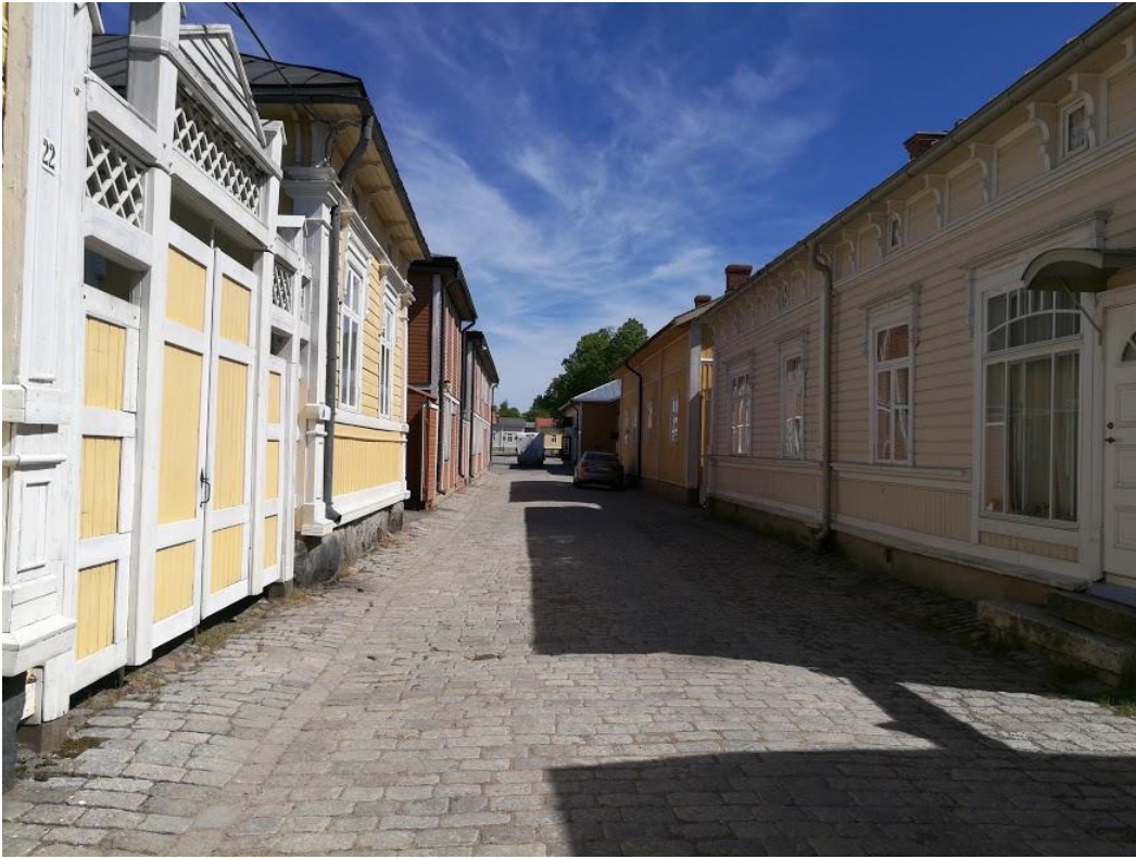
Vanhan Rauman puutalokortteli