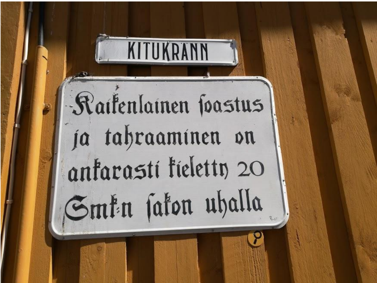
Kyltti Suomen kapeimman kadun seinässä