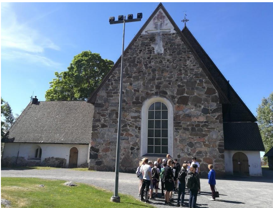
Pyhän ristin kirkko

Vanhassa Raumassa tutustuimme oppaiden johdolla Pyhän ristin kirkkoon, joka oli alun perin katolisten friskaanimunkkien kirkko, mutta siitä tehtiin luterilainen kirkko, koska Pyhän kolminaisuuden kirkko paloi 1600-luvulla.