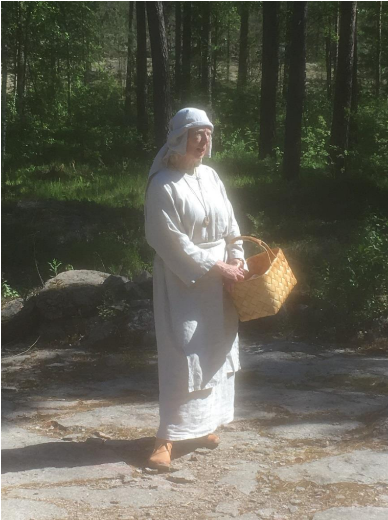
Opas pronssikaudenmukaisessa asussa