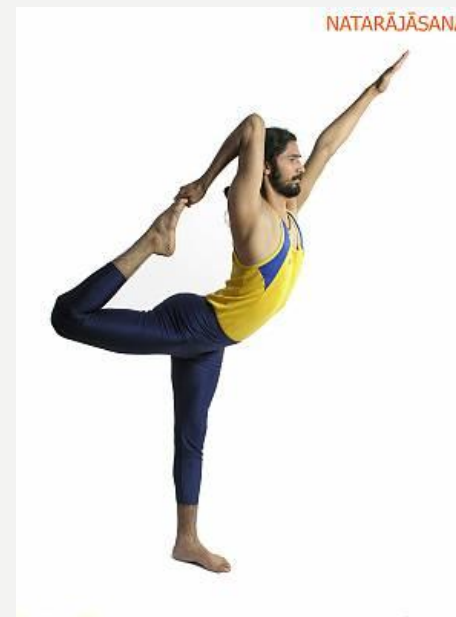
Intialainen jooga on yksi esimerkki maailman aineettoman kulttuuriperinnön kohteista. Lisää kohteita löytyy täältä .