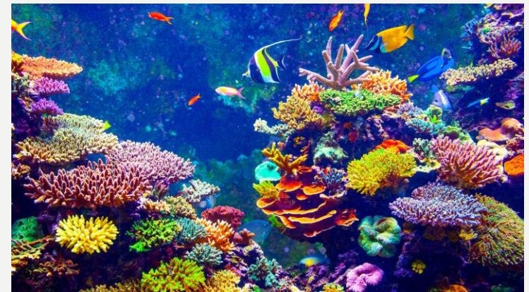
Australian suuri valliriutta on yksi Unescon maailmanperintökohteista