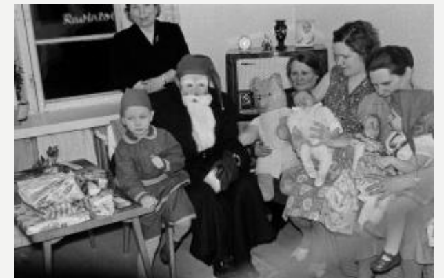
Suomessa on kuitenkin oma kulttuuriperinnön lista, josta löytyy mm. joulupukkiperinne

Elävän perinnön kansallinen luettelo löytyy täältä!