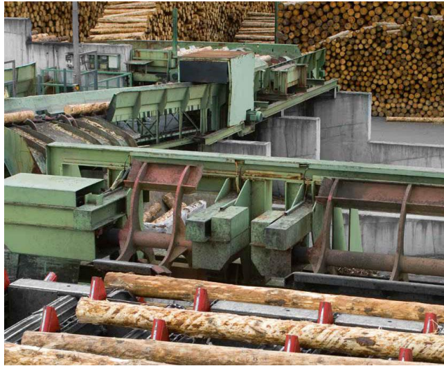
puunjalostus, puuraaka-aineen muokkaaminen